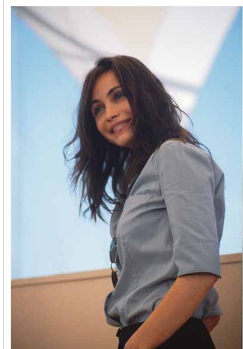
Emmanuelle Béart al Festival di Cannes 2000,